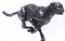
Gepard Biznesu 2011

ING Bank Śląski Wrocław Nr: 91 1050 1575 1000 0023 1691 2753