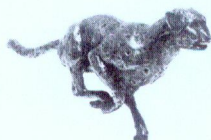
Gepard Biznesu 2011

Bank Gospodarstwa Krajowego Oddział we Wrocławiu Nr 45113010330018800155200002