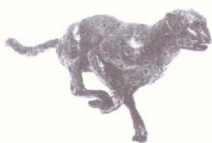
Gepard Biznesu 2011

Bank Gospodarstwa Krajowego Oddział we Wrocławiu Nr 45113010330018800155200002