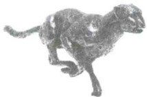
Gepard Biznesu 2011

Bank Gospodarstwa Krajowego Oddział we Wrocławiu Nr 45113010330018800155200002